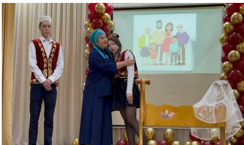
5. «Хәзинә» командасы ДАҢБУ «Түбән Кама транспорт инфраструктурасы көллияте»