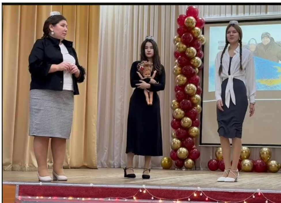
4. «Ак чәчәкләр» командасы «ДАҢБУ «Казан медицина көллияте»