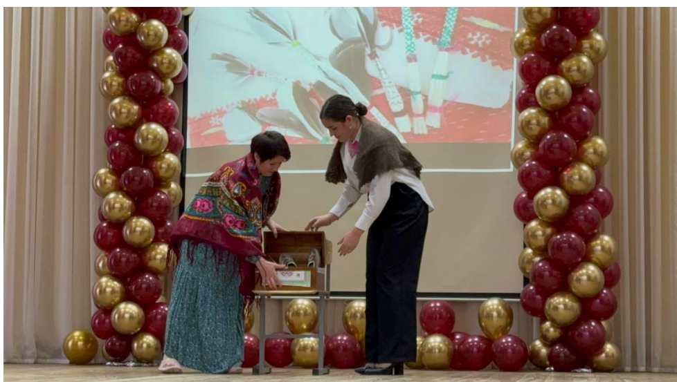
3. «Сәмрух» командасы ДАҢБУ «Казан педагогика көллияте»