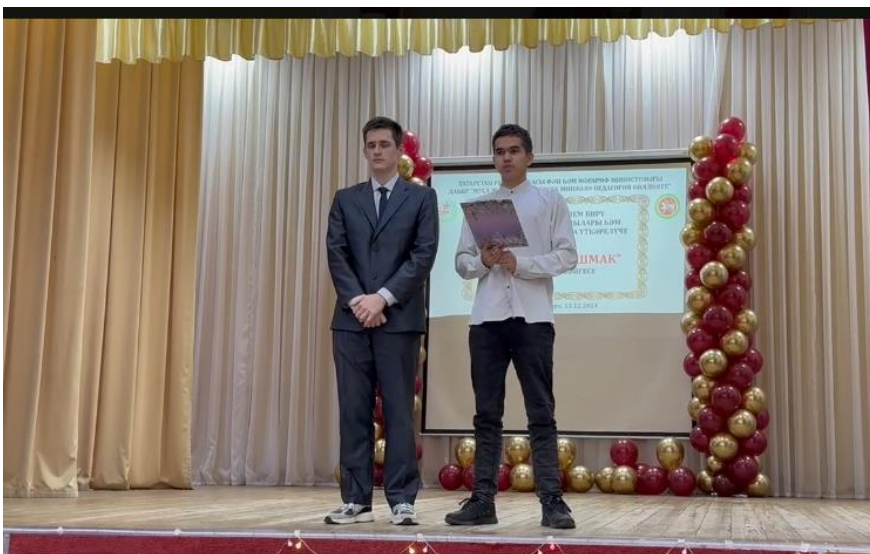
1.«Чулман» командасы ДАҢБУ «Алабуга политехник көллияте»