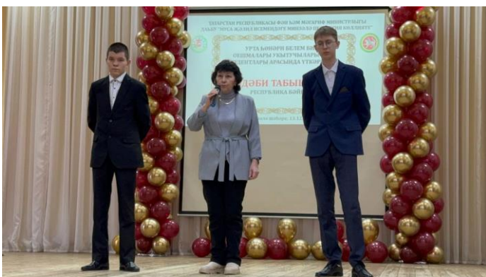
2.«Эрудит» командасы ДАҢБУ «Актаныш технология техникумы»